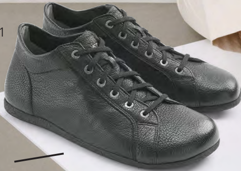
EDLES MUFFLON- LEDER